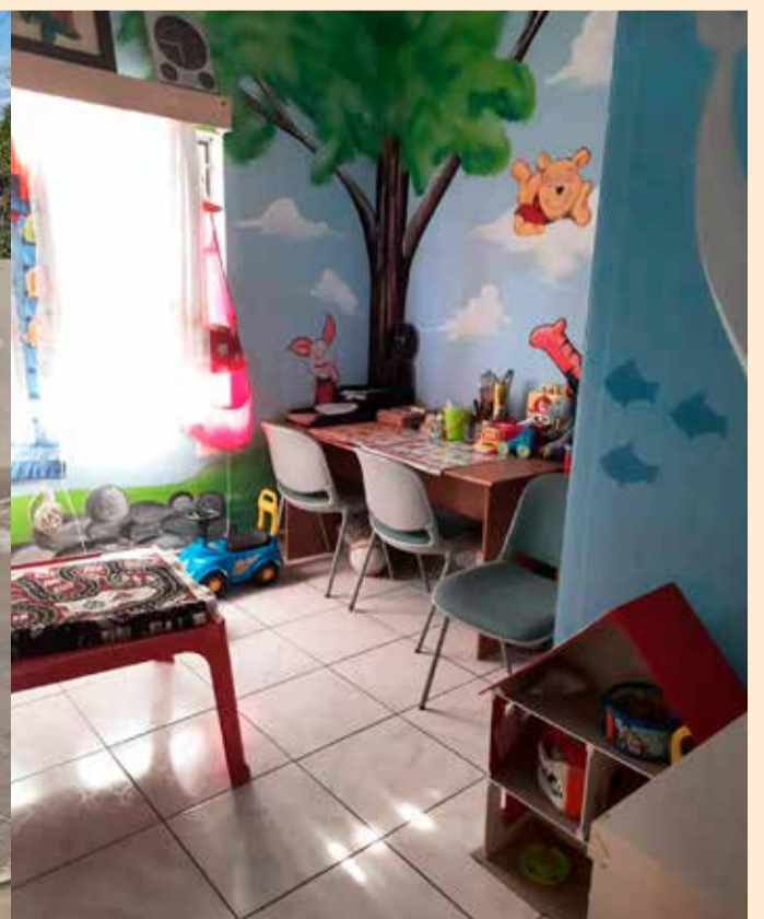
Frauenhaus in Windhoek