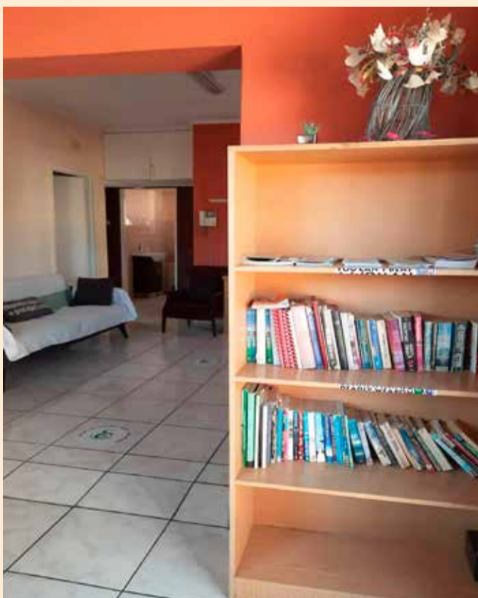
Frauenhaus in Windhoek